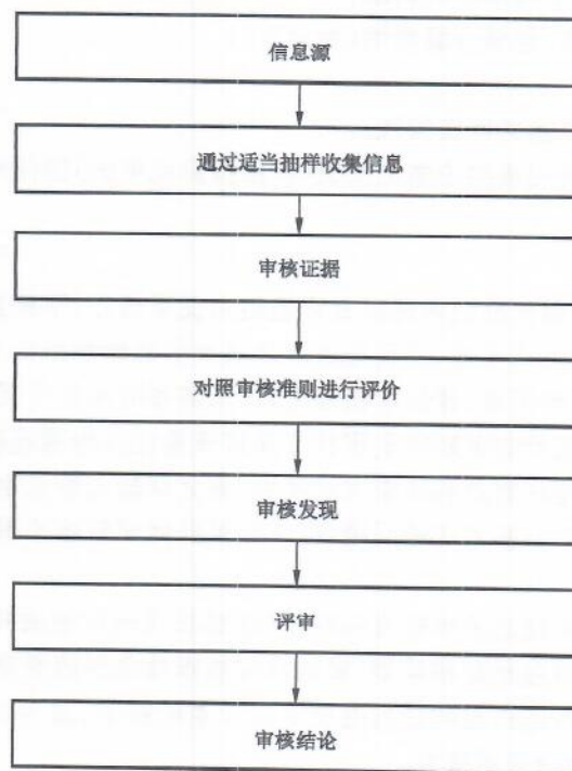
图 2 收集和验证信息的典型过程概述